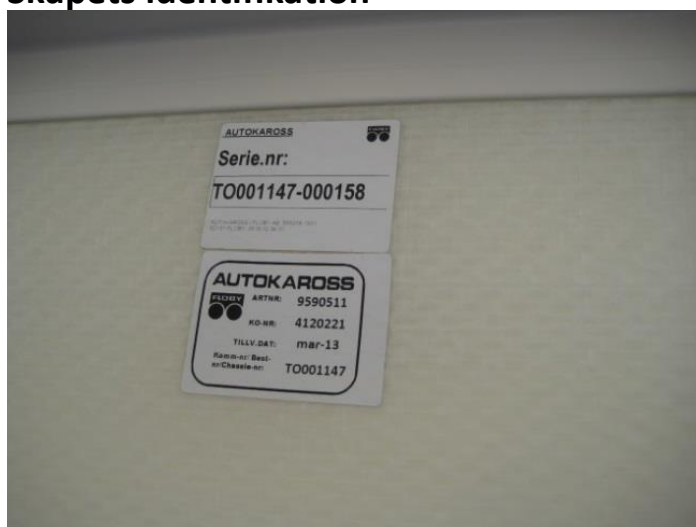
Figur 1.1: Typetikett i skåp