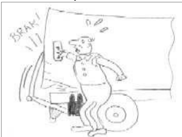
Figur 1.3: Felaktigt handhavande

Många skador kan relateras till felaktigt handhavande. Många tillbud på fordonen beror på olika typer av påkörningsskador samt överlastning. Det är därför väldigt viktigt att föraren är medveten om bilens lastförmåga, lastsäkringsutrustning, fordonets totalhöjd samt vridcentrum vid svängning.