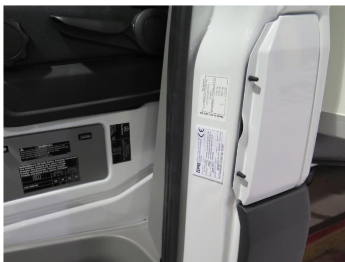
Figur 1.2: Typetikett innanför förardörr

För att lätt kunna identifiera skåpet så är varje skåpsexemplar märkt med en eller flera typetiketter, se figur 1.1 och figur 1.2.