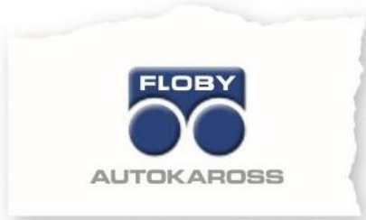
3D-logotyp 2-färg/ 3D-logotyp 4-färg