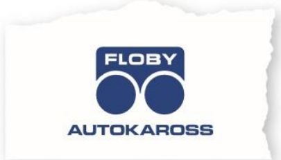
1-färg PMS 280